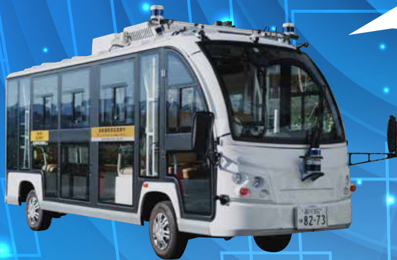
自動運転小型EVバス「GSM8」

阪神電車では、魅力あふれる沿線の実現を目指し、次世代モビリティの実用化に向けた取り組みを行っています。今回は、甲子園エリアの公道で初めて自動運転小型EVバスが走行します！この機会にぜひ乗車してみませんか？